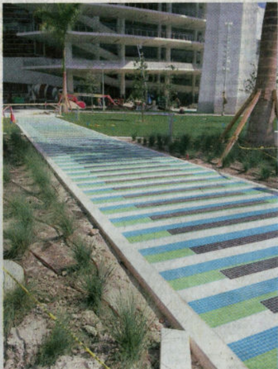
'ADDITIVE COLOUR', INTERVENCIÓN EN DOS PASOS PEATONALES PARA LA FERIA ART BASEL MIAMI BEACH, 2010.

Arte Américas, abierta al público en el Centro de Convenciones de Miami Beach, Hall A, 1901 Convention Center Drive. Hoy domingo de 12 m. a 9 p.m. Mañana lunes 12 m. a 5 p.m. www.arteamericas.com