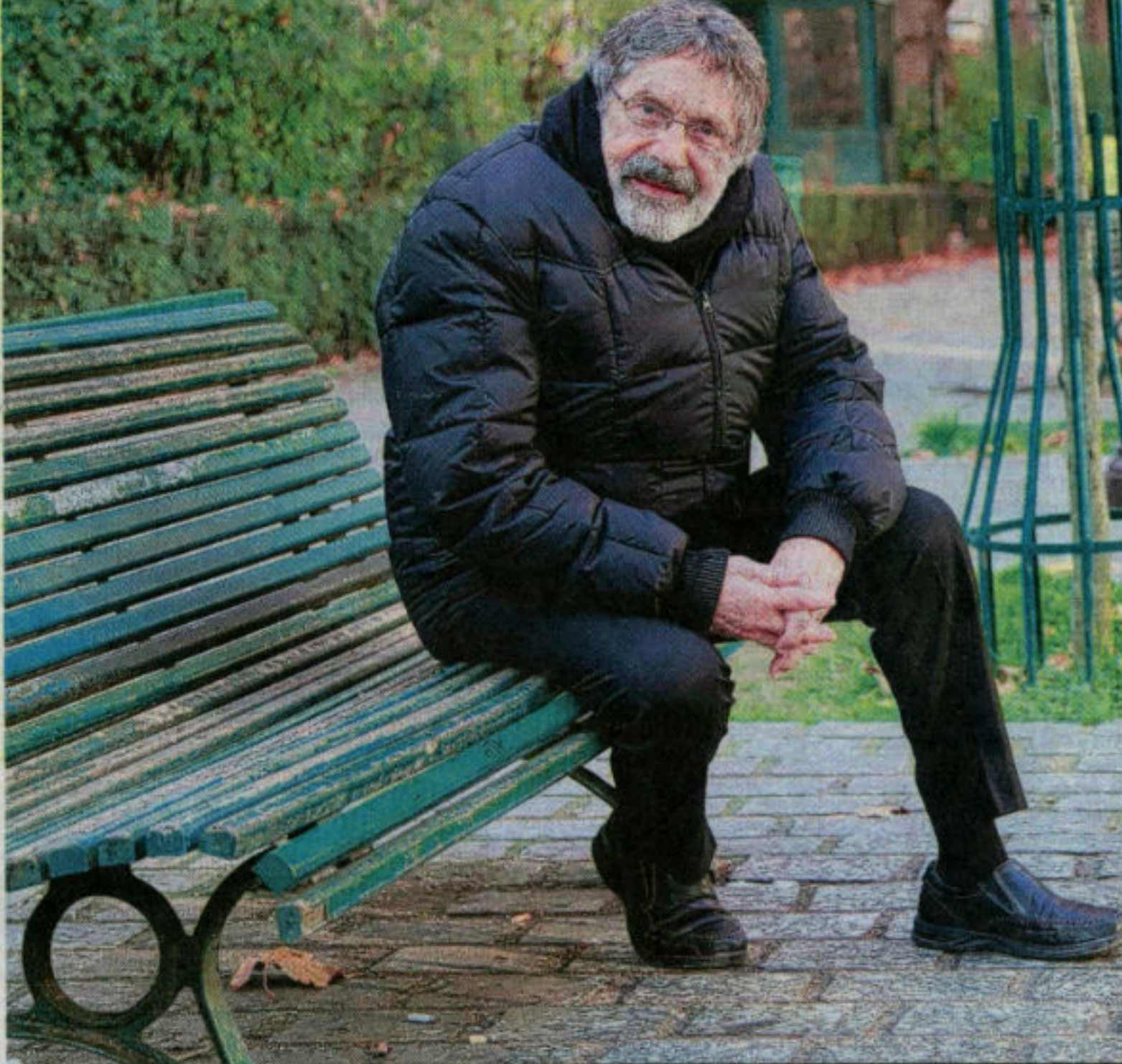
EL ARTISTA CARLOS CRUZ-DIEZ EN PARÍS, 2011.