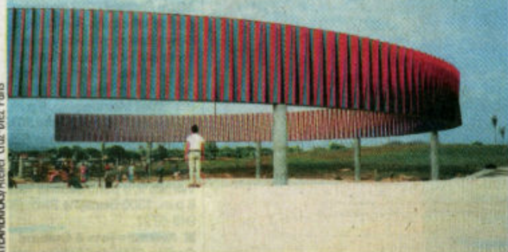
FISICROMÍA DOBLE FAZ PARA VALENCIA, PLAZA DE TOROS. MONUMENTAL ESTRUCTURA CIRCULAR. VALENCIA, VENEZUELA, 1998.